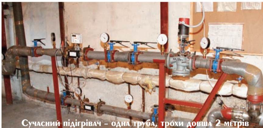
Сучасний підігрівач – одна труба, трішки довша 2 метрів

Реалізація програми в ЗНУ розпочалася з проведення перерахунку теплонавантаження. Теплове навантаження – це абонентська плата за те, що організація підключена до теплової мережі. Вона вираховується з кількості радіа-