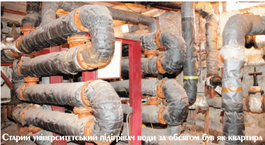
Старий університетський підігрівач води за обсягом був як квартира

Щоб тепло в університетських корпусах не витрачалось даремно, передбачили і заміну старих вікон на сучасні склопакети. Так, у 2009 році оновився скляний фасад спортивного корпусу та вікна в навчальних корпусах. Усього було встановлено близько 1000 квадратних метрів нових вікон, але робота ще триває – поступово в ЗНУ планують замінити всі старі вікна. За попередніми розрахунками, це дозволить університету економити 100 тисяч гривень на рік.