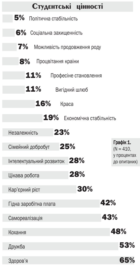
Графік 1. (N = 410, у процентах до опитаних)

Що людині потрібно для щастя?! Трохи розуміння, уваги, гарного самопочуття – ці, здавалось би, нехитрі цінності складають для сучасної молоді базис, на якому вона будує власне життя.