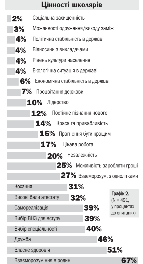
Графік 2. (N = 491, у процентах до опитаних)

На першому місці у школярів взаєморозуміння в родині, це пояснюється й відсутністю досвіду проживання окремо від батьків. Тоді як студенти більше занепокоєні власним здоров'ям. Що ж до професійно орієнтованих цінностей, таких, як вибір спеціальності чи ВНЗ для продовження навчання, що мають не абияку актуальність для завтрашніх абітурієнтів, то у студентів вони замінюються міжособистісними зв'язками, що втілюються у коханні та дружбі. При цьому власне особисте життя молоді, що навчається у вишах, прагне поєднувати з не менш важливим для неї трудовим шляхом та професійним становленням.