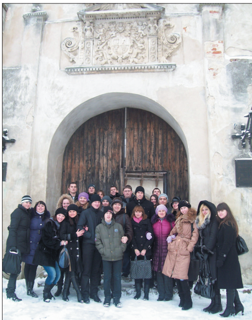
Студенти ЗНУ на екскурсії замками Львівщини

ченні ялиці та сосни – ми опинилися у казковому селі 17 століття.