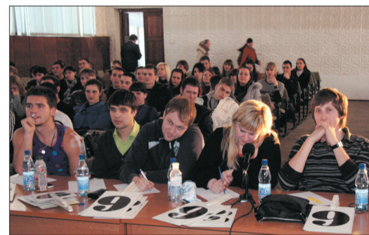
Досвідчене журі оцінює команди КВН

Його члени традиційно мали обрати лише дві команди-переможниці з кожного дня півфіналу, але