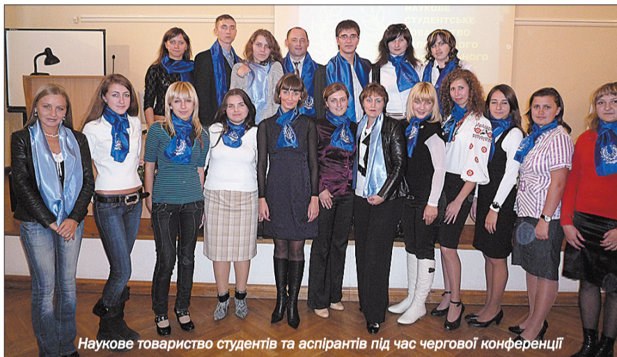
Наукове товариство студентів та аспірантів під час чергової конференції

Останнім часом суттєво зросла кількість перемог у загальноукраїнських, регіональних конкурсах та олімпіадах студентів і випускників ЗНУ. Не менш успішно молоді науковці нашого вишу нашого презентують діючі моделі й винаходи не тільки в Україні, а й на міжнародних наукових конкурсах і конференціях. Неабияке значення для зростання рівня наукової роботи студентів ЗНУ має діяльність Наукового товариства студентів і аспірантів, яке діє на базі нашого ВНЗ уже п'ять років.