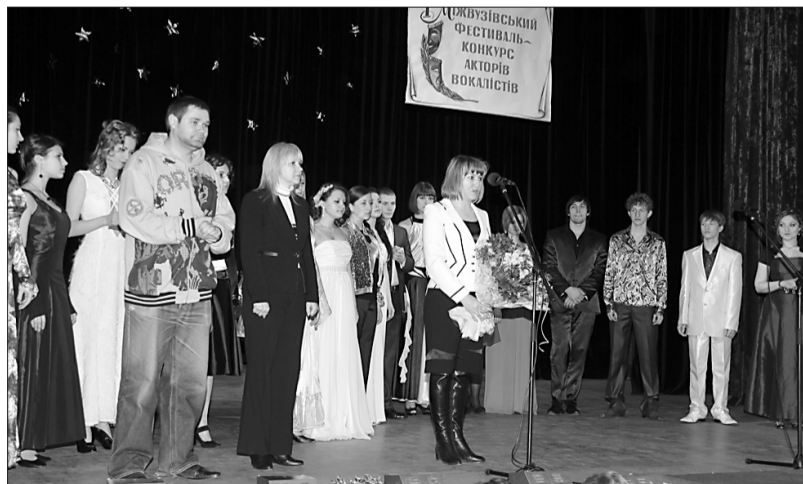
Привітання учасників фестивалю від ректорату ЗНУ