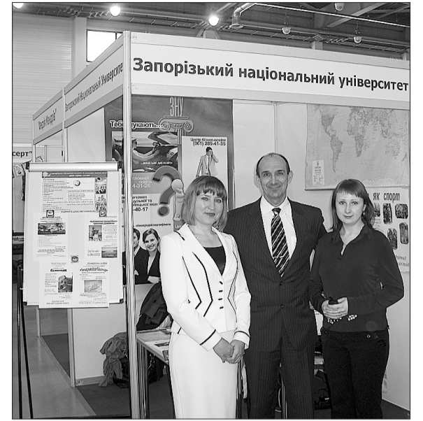
Презентація ЗНУ на Межрегіональній виставці

Також під час семінару ми дізналися, що існує пропозиція створити музей старовинних кораблів, тим паче, що на Хортиці вже є чотири кораблі, які потребують реставрації. Ідея дуже цікава, адже у