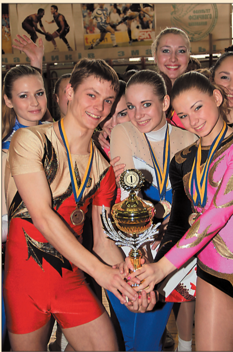
Наші спортсмени – найкращі!

Усього у змаганнях взяли участь 368 спортсменів з 12 областей України. Вони представили 27 ВНЗ з Автономної республіки Крим, Дніпропетровської, Донецької, Житомирської, Запорізької, Луганської, Львівської, Сумської, Тернопільської й Харківської області, а також з Києва і Севастополя.