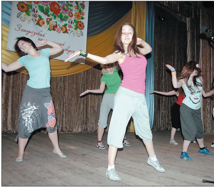
На сцені – факультет іноземної філології

День другий. Філологічний факультет зробив акцент на колоритних українських піснях, костюмах, танцях. Концепцією виступу стала тема зустрічі студентів 1992 року з сучасними.