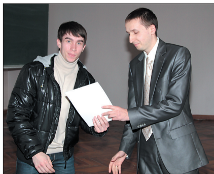
Нагородження переможців олімпіади з економічної кібернетики

■ В олімпіаді з програмування взяли участь 17 команд області: Мелітопольського державного педагогічного університету, Таврійського державного агротехнологічного університету, Бердянського державного педагогічного університету, КПУ, ЗДІА, ЗНТУ, ЗІЕІТ та ЗНУ. Олімпіада тривала 5 годин в режимі он-лайн системи проведення олімпіад «ejudge». Спосори – компанії «IBM» та «PRIMA development group». За