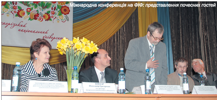
Міжнародна конференція на ФІФ: представлення почесних гостей

Саме у рамках Фестивалю науки відбулася V Міжнародна конференція «Інноваційні ідеї молоді в соціально-економічному розвитку України XXI