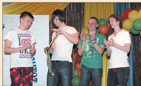
Команда «Уп'яточки» розбирає бронзові медалі

Найбільшою несподіванкою для гравців став новий конкурс, який члени журі вигадали майже за день до фіналу. У ньому кожна команда повинна була привітати іншу з