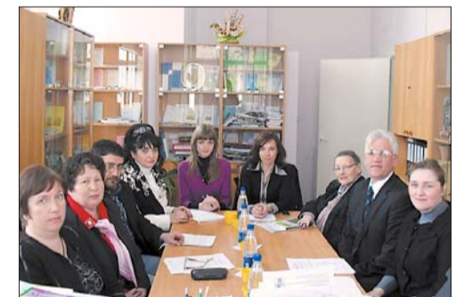
Під час обговорення майбутніх напрямів співпраці з нашим університетом

співробітництва з біологічним факультетом задля створення та впровадження у Запорізькій області інноваційної системи виробництва, переробки та реалізації екологічно чистих продуктів харчування. Вони виявили зацікавленість у студентській науковій діяльності та висловили готовність залучити науковий потенціал молодого покоління до розробки цікавих проектів, надавши матеріальну і технічну підтримку.