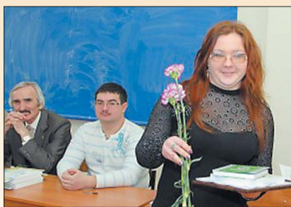
Під час нагородження переможців конкурсу ім. Ковальських

Нагадаємо, що у 2009 році в цьому конкурсі перемогу виборола Ана-