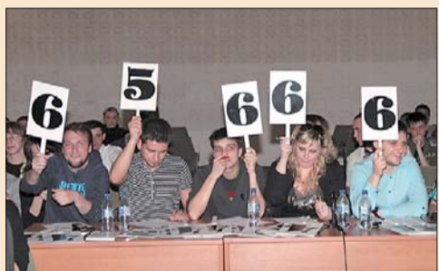
Вимогливе журі задоволене виступами учасників

Днем народження та вирішити, що б вони хотіли подарувати іменинникам. У гравців майже не було часу як слід підготуватися до виконання цього завдання, але всі вони впоралися із привітаннями, довівши, що гідні участі у фіналі.