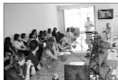
Нагородження переможців конкурсу

«Есе відображає моє дещо скептичне ставлення до пафосу так званих вічних тем, зокрема чорнобильської. Я аналізував сучасні комп'ютерні ігри про Чорнобиль («Сталкер» та інші), які пронизані псевдоромантикою щодо відвідин цієї території після катастрофи. У моїй роботі існує паралель: реалії сьогодення та нібито захоплива гра. Насправді у житті ніякої романтики в цьому питанні немає. Досі я писав рекламні матеріали для журналу «Афіша», вів рубрику «Техно», тож останній мій твір став відображенням мого внутрішнього світу.»