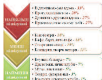
Малюнок 3. Рейтинг місць відпочинку серед студентів ЗНУ (N=245, можливо кілька варіантів відповіді)

Запорізький національний університет намагається не залишатись осторонь дозвілля студентів, займаючись організацією різноманітних заходів (розважальних, наукових, спортивних тощо). Тому наш університет впевнено можна назвати не тільки осередком навчальної діяльності, але й місцем, у якому приємно проводити вільний час, беручи участь у різноманітних подіях.