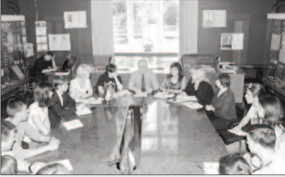
Продовження. Початок на 1 сторінці

– У цьому навчальному році, як і в попередньому, тривають масштабні роботи із благоустрою території ЗНУ та оновлення його матеріально-технічної бази. Однак при цьому відбувається більш масштабне залучення усього колективу ЗНУ до такої діяльності. Яскравим прикладом цього стало проведення конкурсу на кращу клумбу між факультетами і структурними підрозділами ЗНУ, який засвідчив креативність та актину позицію викладачів, співробітників і студентів нашого вишу. Чи плануєте подальші кроки в цьому напрямку?