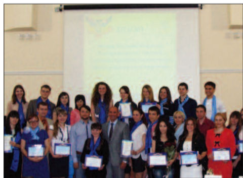
Молоді науковці ЗНУ

Попри складні соціально-політичні умови, в яких зараз перебуває наша країна, можна із упевненістю сказати, що цей рік був вдалим для Запорізького національного університету: він підходить до свого 85-річчя з багатьма здобутками й перемогами. І в цьому, на мою думку, чимала заслуга всього великого і дружнього колективу вищого навчального закладу. Зараз у цьому університеті, який входить до 25 найкращих вишів України, навчається близько 12 тисяч студентів. Я глибоко переконаний, що сек-