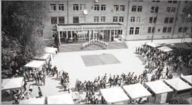
День Європи в ЗНУ

Така активізація міжнародної діяльності пояснюється, почасти, концепцією вивчення іноземних мов, яка уже другий рік діє в нашому університеті. Ми впевнені, що вивчення іноземних мов упродовж усього періоду навчання у виші сприяє конкурентоздат-