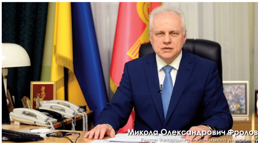
Микола Олександрович Фролов Ректор Запорізького національного університету

Цього року ми отримуємо дуже багато питань у зв'язку з ціноутворенням на контрактну форму навчання, адже 3 березня поточного року Кабінет Міністрів України затвердив постанову № 191, яка встановила так звані індикативні ціни. Підкреслюю – на 36 спеціальностей для вступу на бакалаврат і магістратуру. Тобто із усіх інших, крім 36 спеціальностей, ніякої індикативної ціни не існує. Вона визначається рішенням кожного конкретно університету. Відразу скажу, що більшість університетів, і наш університет у тому числі, не підтримують цю так звану індикативну ціну, але ми зобов'язані, скажімо, орієнтуватися на ті ціни, які нам встановлює держава. Тобто за 36 спеціальностями не університет, а держава встановлює конкретну ціну для кожного університету. Про так звані індикативні ціни буде на нашому сайті розміщена