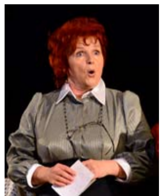
Вистава «Дикун» за п'єсою Александро Касоне. Новий театр. 2016 р.

– Для мене всі ролі, зіграні в театрі, цінні. Я працювала над ними з великим ентузіазмом і радістю. Найбільш значущими роботами, зробленими в театрі юного глядача, я вважаю